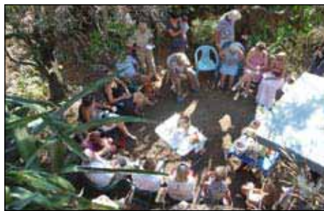
▲ Conversations dans les berges de Gassin

Dans ces sous-bois prospéraient jadis toutes sortes de légumes, pois chiche, fèves, haricots, tomates, salades... Durant