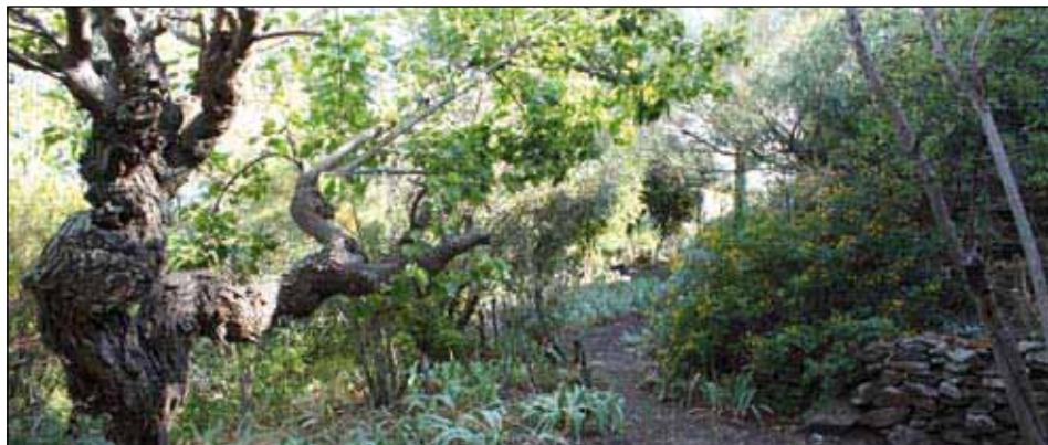
▼ Le jardin de Marie-Thérèse L'Hardy ? Un espace en mouvement !