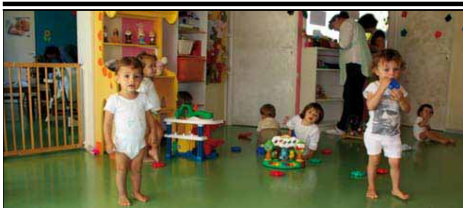
A Gassin, l'apprentissage de la vie en commun commence ici !

D EPUIS L'ÉDITION PRÉCÉDENTE (juillet 2009), vous devez avoir reçu un exemplaire de «La Vie Gassinoise», le support d'information de la mairie de Gassin, à votre domicile via La Poste. C'est une évolution sensible dans le souhait des élus de mieux communiquer et de mieux faire connaître leurs réalisations, leurs projets et leurs réflexions sur le territoire que nous partageons. Tout système n'étant pas parfait, vous avez peut-être été oublié dans cet envoi en nombre dorénavant régulier. Aussi, n'hésitez pas à vous faire connaître auprès des services de la mairie si vous n'aviez pas reçu l'épisode précédent !