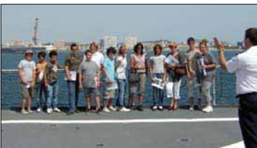
Visite de "La Meuse" dans la rade de Toulon