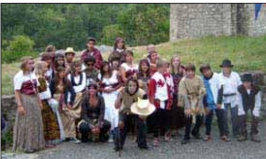
Aux Médiévales de Colmar

non, de domaines souvent parcellés et dont le produit de la vigne est chaque année vinifié dans les caves coopératives de Ramatuelle (principalement), Cogolin ou Grimaud.