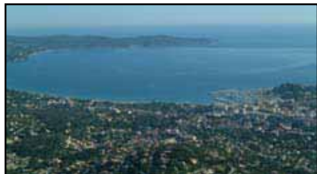
La baie de Cavalaire

Les récentes festivités qui ont marqué les 80 ans de Cavalaire rappellent que le territoire de cette commune voisine, située au-delà de La Croix-Valmer, appartenait, jusqu'en 1929, à Gassin.