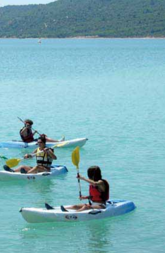
Kayak au lac de Sainte Croix