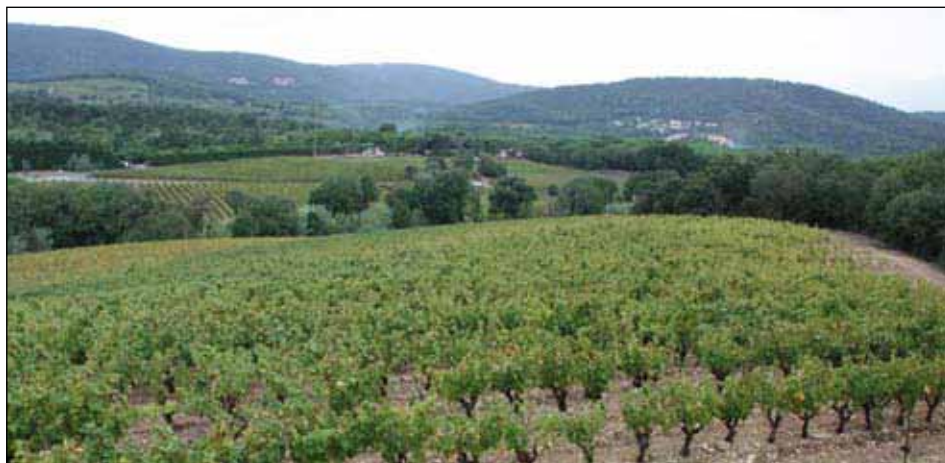
Le vignoble gassinnois couvre aujourd'hui plus de 500 ha