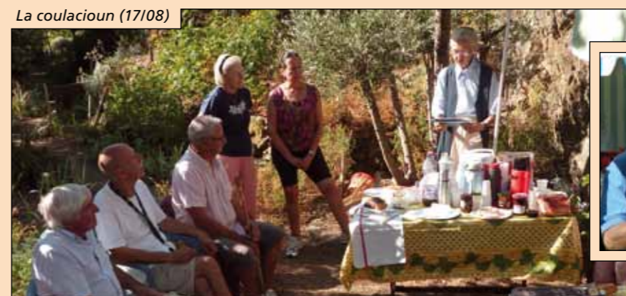
La coulacioun (17/08)