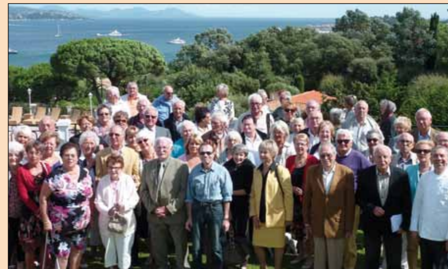
Les 35 ans de l'Âge d'Or à la Villa Belrose (17/09).

Président de l'OMACL, office municipal des arts, de la culture et des loisirs