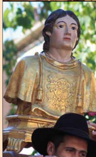
Fête patronale de la Saint Laurent