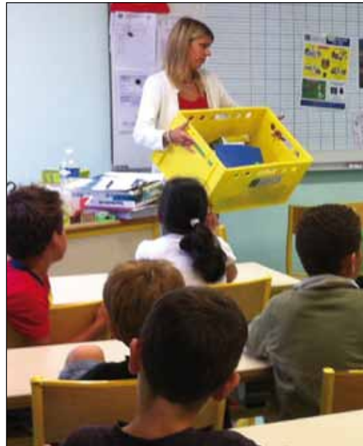
◀ ▲ Le tri, des gestes qui s'apprennent très tôt