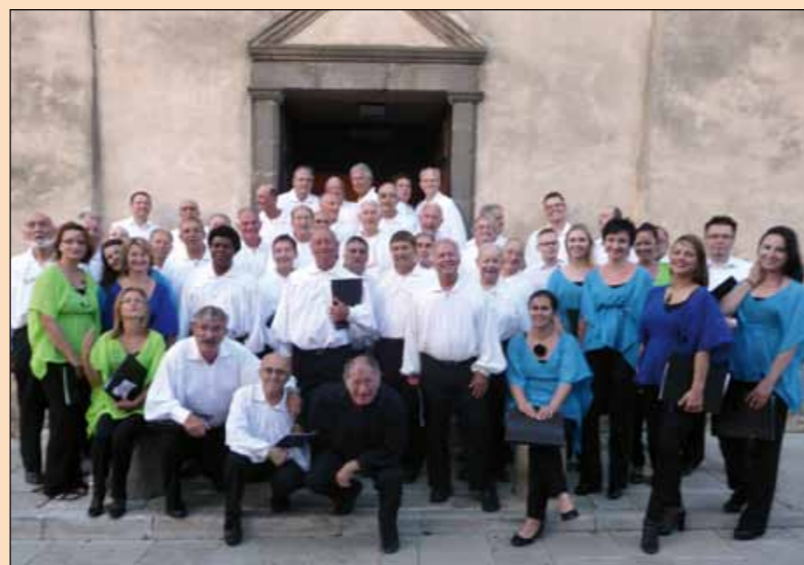
Chorale et chœur de Pologne