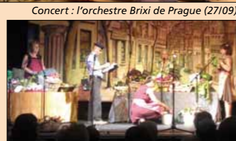
Théâtre : « la Belle de Besagne » (21/09)