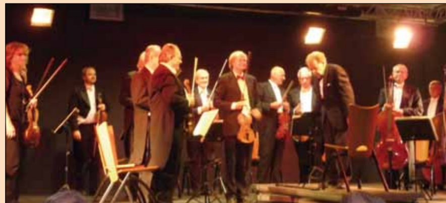
Concert : l'orchestre Brixi de Prague (27/09)

La salle de l'Espéridou appartient donc plus que jamais aux Gassinois. Souhaitons en cette rentrée automnale 2013, qu'ils seront toujours plus nombreux à la fréquenter.